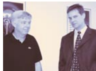
Sie sind mit dem neuen Schichtsystem zufrieden – die Mitarbeiter in Duisburg (siehe Foto oben und Mitte).